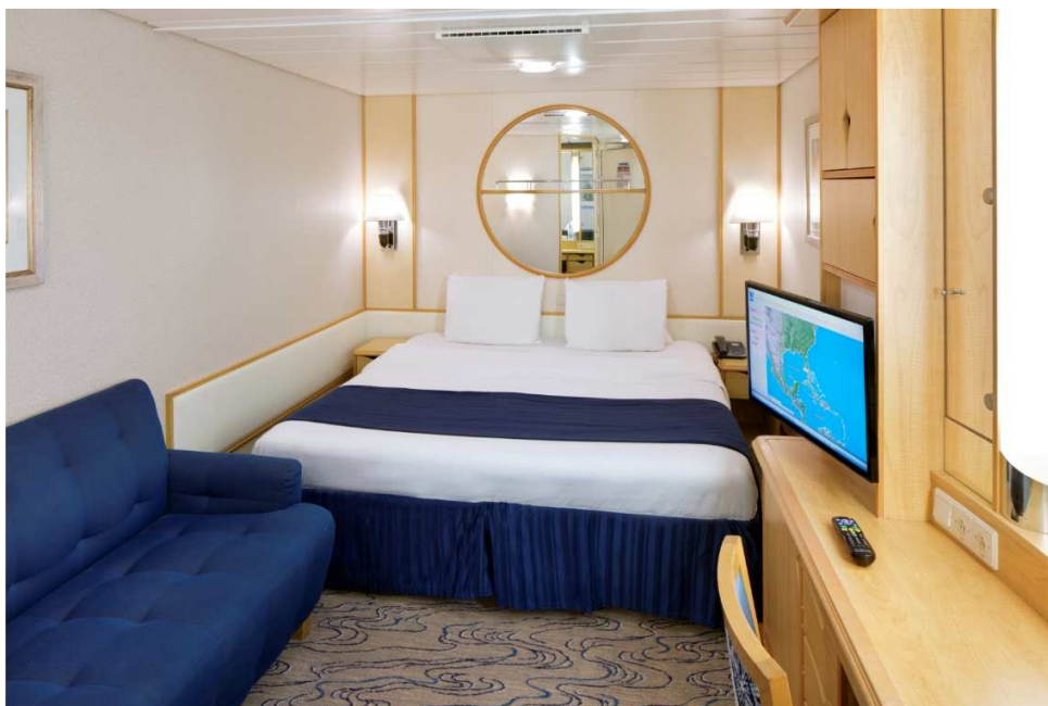
ห้องพักแบบ Interior / ไม่มีหน้าต่าง

**ตรวจสอบห้องพักกับเจ้าหน้าที่ทุกครั้งก่อนทำการจองห้องมีจำนวนจำกัด**