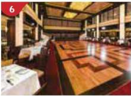
Dream Dining Room Savour a wide variety of Asian and international cuisine.