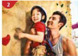
Rock Climbing Wall Challenge yourself on our mountainous rock climbing wall.