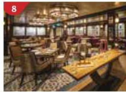
Bistro By Mark Best Relish contemporary Western cuisine from the internationally-acclaimed Australian chef.