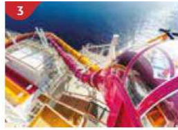
Waterslide Park Get drenched in fun on one of our six different waterslides.