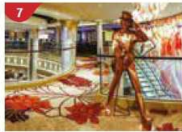
Johnnie Walker House™ Immerse yourself in the intricate world of premium Scotch whisky.