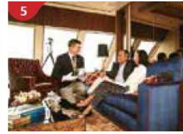
The Palace Indulge in European-style butler service and exclusive facilities.