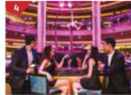
Bar 360 Catch live music and aerial acrobatic performances with a glass of champagne.