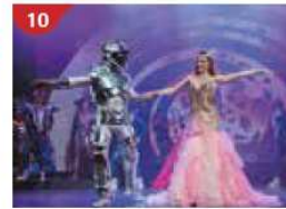
Zodiac Theatre Enjoy live production shows from the acclaimed award-winning entertainment team.