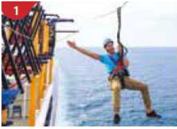
Ropes Course & Zipline Feel the thrill of gliding above the ocean on a 35-metre zipline.