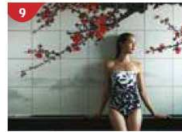
Crystal Life™ Spa Rejuvenate mind, body and soul with our holistic Western and Asian spa experience.