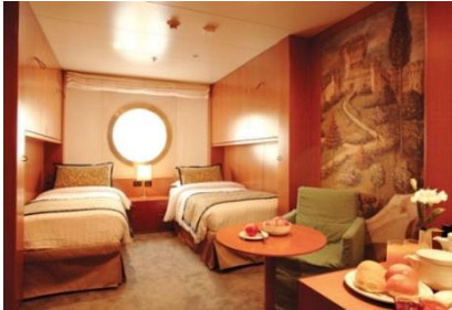
ห้องพักแบบมีหน้าต่าง ขนาด 16.6 ตารางเมตร