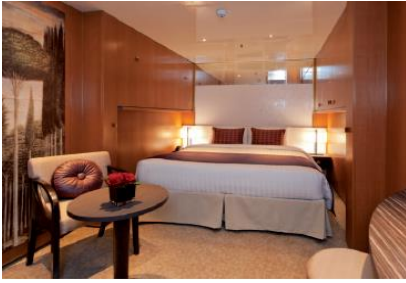
ห้องพักแบบไม่มีหน้าต่าง ขนาด 16.6 ตารางเมตร