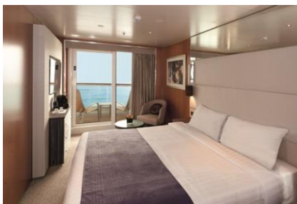
ห้องพักแบบมีระเบียง ขนาด 24.2 ตารางเมตร