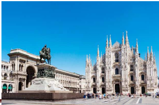
EK009 FRANCE SWISS ITALY ปารีส-โรม

☀️ บริการอาหารกลางวัน ณ ภัตตาคาร หลังจากนั้นนำท่านเดินทางสู่ กรุงมิลาน (MILAN) เมืองสำคัญทางภาคเหนือของอิตาลี ตั้งอยู่บริเวณที่ราบลอมบาร์ดี ชื่อเมืองมิลานมาจากภาษาเซลต์คำว่า MID-LAN ซึ่งหมายถึงอยู่กลางที่ราบ มีชื่อเสียงในด้านแฟชั่นและศิลปะนำท่านถ่ายรูปบริเวณ ปิอาซซา ซา เดล ดูโอโม (Piazza Del Duomo) ซึ่งเป็นที่ตั้งของมหา