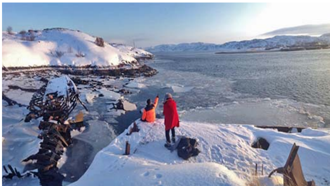
ภาพอันสวยงามของทุ่งเทนดราห์ ที่มีหิมะปกคลุมขาวโพลนสุดสายตา

เช้า รับประทานอาหารเช้า ณ ห้องอาหารของโรงแรม นำท่านเดินทางสู่เมืองเทอริเบอร์ก้า (Teriberka) เมืองเล็กๆ อยู่ในเขต Arctic Circle (ขั้วโลกเหนือ) ตั้งอยู่บนอ่าวโคลา (Kola) ซึ่งอยู่สุดปลายแผ่นดินรัสเซียทางทิศตะวันตกเฉียงเหนือของประเทศไทย แถบนี้มีอาณาเขตเขตป่าสงวนที่ใหญ่ที่สุดในโลกอันดับ 1 ของโลก และมีทางออกสู่มหาสมุทร 3 แห่ง เดิมเคยเป็นท่าเรือขนส่งขนาดใหญ่ และเป็นแหล่งที่มีสัตว์น้ำอุดมสมบูรณ์ แต่หลังสงครามโลกครั้งที่ 2 ทางรัฐบาลได้ย้ายท่าเรือไปที่เมืองมูร์มันส์ค นำท่านชมหมู่บ้านประมงซึ่งเป็นหมู่บ้านที่มีประชากรเพียง 800 คน ระหว่างเดินทางท่านจะได้ชมทัศนียภาพอันสวยงามของทุ่งเทนดราห์ ที่มีหิมะปกคลุมขาวโพลนสุดสายตา