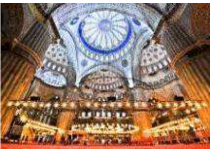
มัสยิดสีน้ำเงิน