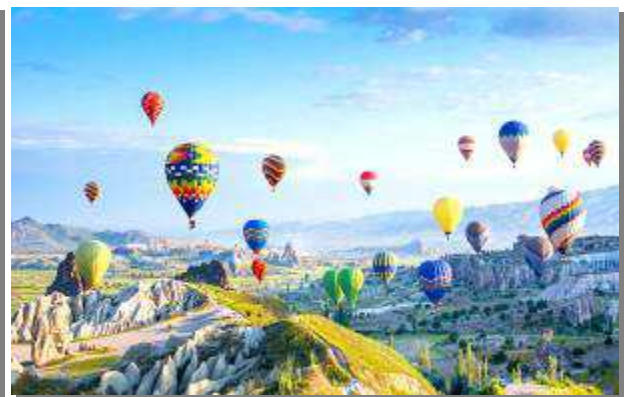
คัปปาโดเกีย, Optional ขึ้นบอลลูน