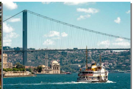
ล่องเรือช่องแคบบอสฟอรัส