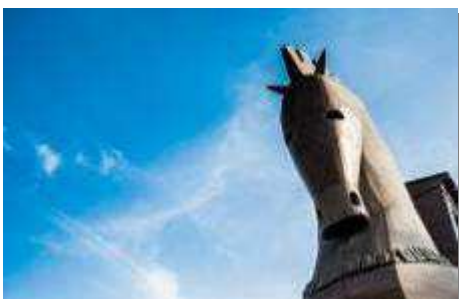
น้ำไม่กรทรอย