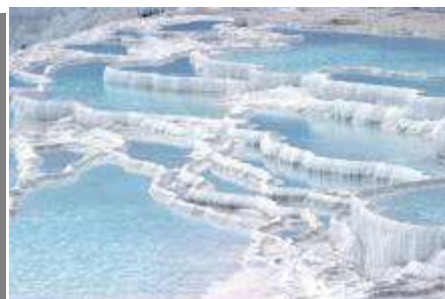
เมืองปามุคคาเล