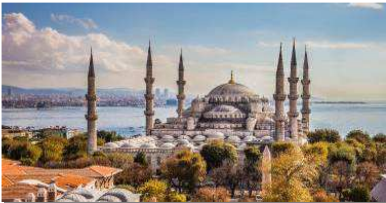
กรุงอิสตันบูล