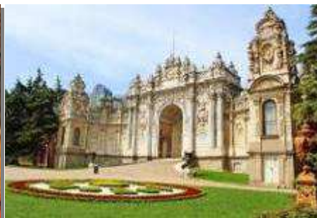
พระราชวังโดลมาบาเซ่