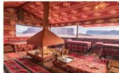
นอนแคมป์

** พักที่ Zawaydeh Camp 4* Hotel หรือเทียบเท่า **