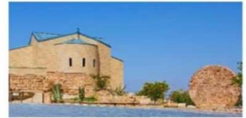
The Moses Memorial Church