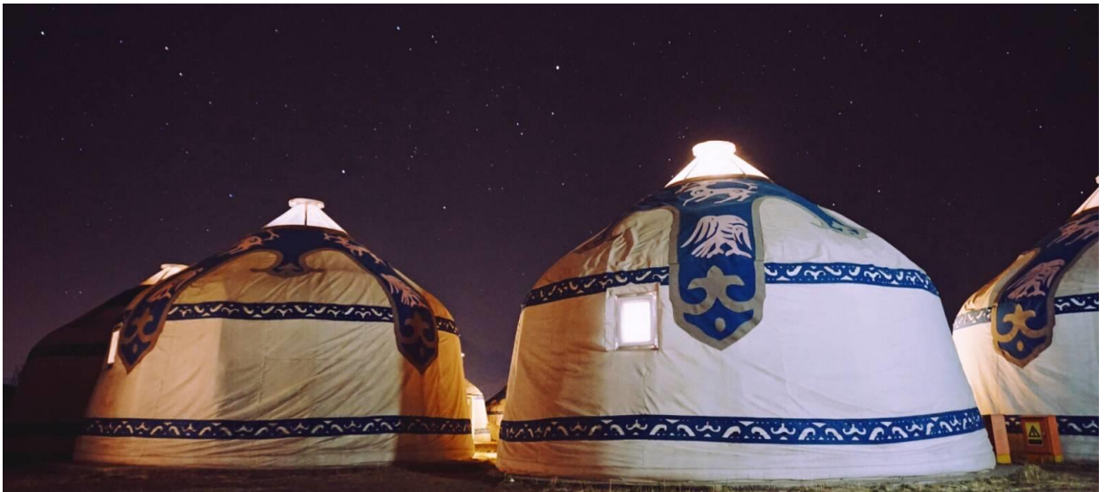
ที่พัก โรงแรม MONGOL YURT หรือเทียบเท่า (ที่พักแบบกระโจมมองโกล มีห้องน้ำในตัว) ไม่มีเตียงเสริม