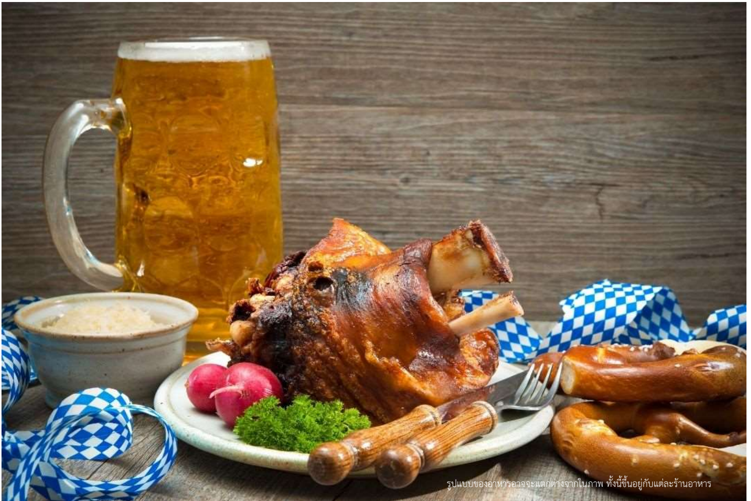
รูปแบบของอาหารอาจจะแตกต่างจากในภาพ ทั้งนี้ขึ้นอยู่กับแต่ละร้านอาหาร

🍷 บริการอาหารค่ำ ณ ภัตตาคาร **เมนูพิเศษ ขาหมูเยอรมันต้นตำหรับ** จากนั้นนำท่านเข้าสู่ที่พัก 🏠 NH Munchen Messe หรือเทียบเท่า